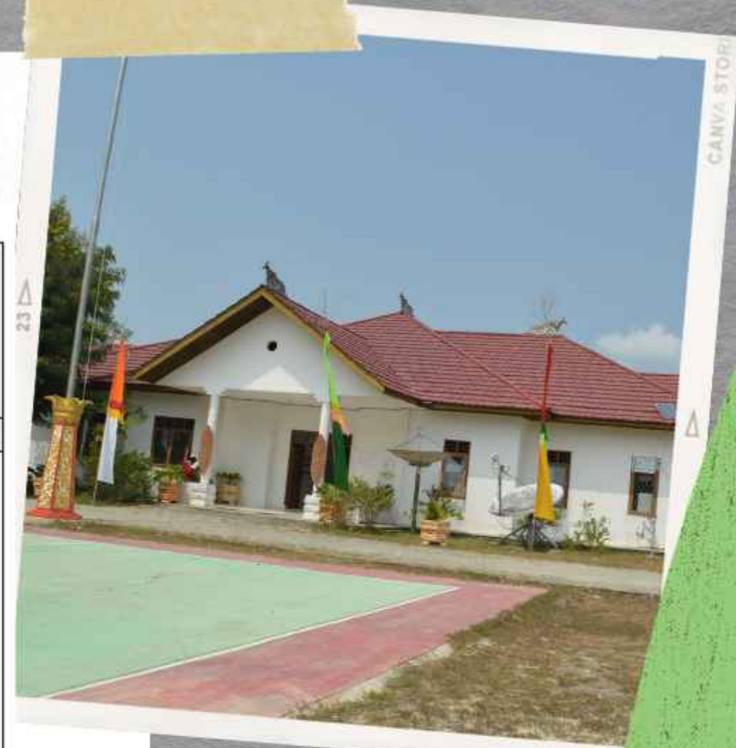
Kantor Camat Mook Manaar Bulatn