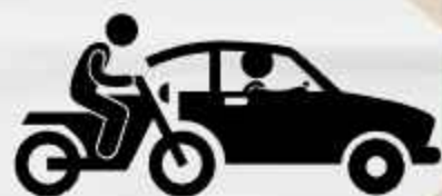
KONDISI TRANSPORTASI JALAN MENURUT DESA