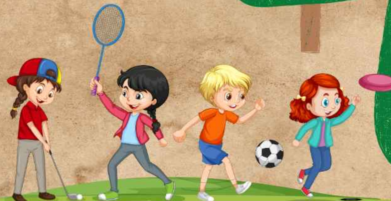
KONDISI SARANA OLAH RAGA MENURUT DESA