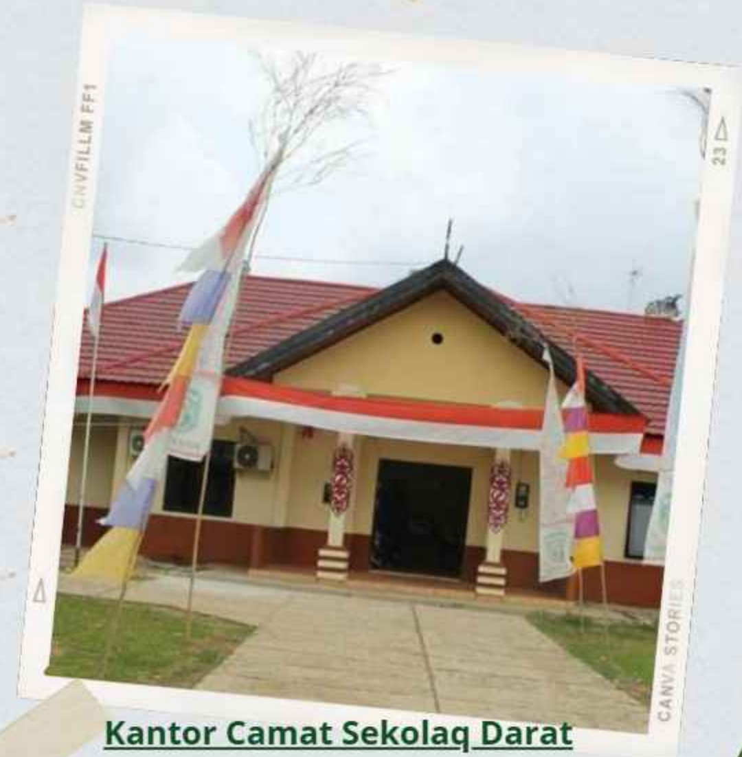
Kantor Camat Sekolaq Darat