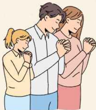
BANYAKNYA SARANA IBADAH MENURUT JENIS